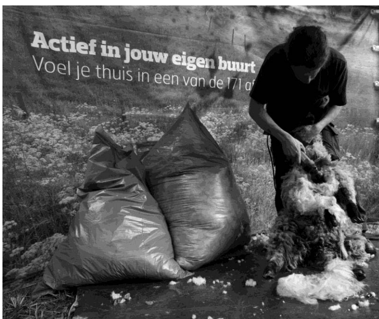
Sfeerbeelden van onze Schapendag van 26 mei: wol kaarden (links) en schapen scheren (rechts)