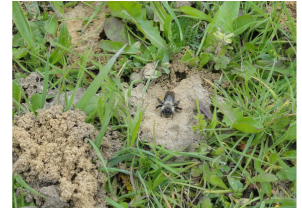
grijze zandbij voor een nestingang