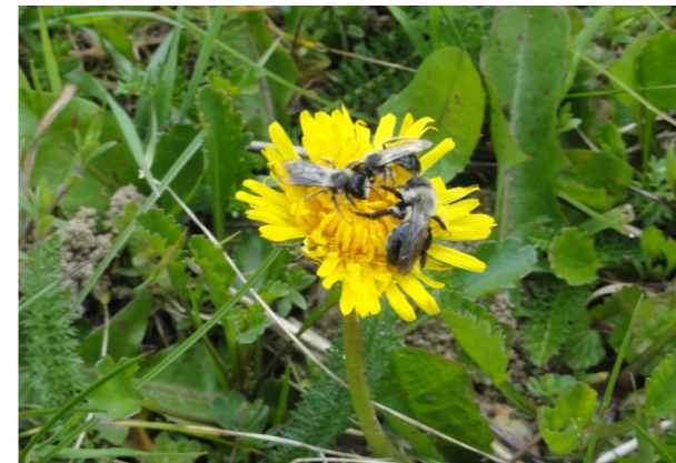
grijze zandbijen op paardenbloem

De eerstvolgende beheerdag op 'de driehoek' vindt plaats op zaterdag 1 juli vanaf 9 uur . Helpende handen zijn zeer welkom! Er zal vooraf gemaaid zijn. De dag zelf harken we vooral het maaisel samen en voeren we het af. De driehoek bevindt zich ter hoogte van de Kerselaarstraat, daar waar de betonbaan langs het kanaal overgaat in een zandweg.