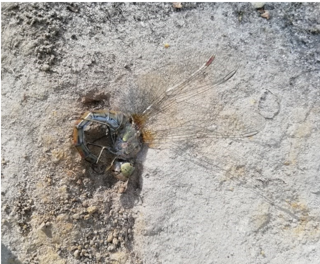
Libel in de valkuil van de mierenleeuw

Begin oktober was ik op stap in het Maldegemveld op zoek naar paddenstoelen toen ik een libel schijnbaar dood op de grond zag liggen. Toen ik die wou vastnemen bleek dat één van de vleugels in een holletje in de grond was getrokken. Dit holletje bevond zich centraal in een trechtersvormig putje.