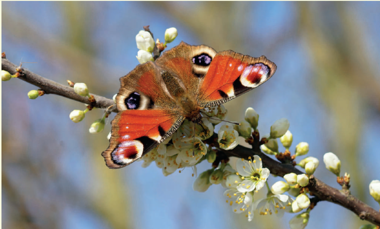
De dagpauwoog is een herkenbare vlinder die het goed doet in boomgaarden