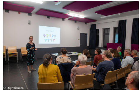
Infosessie Steenokkerzeel