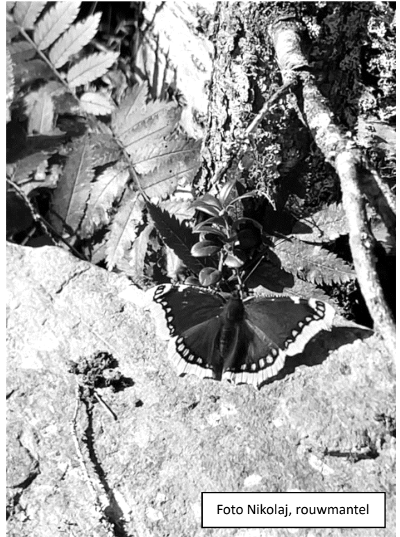
rouwmantel