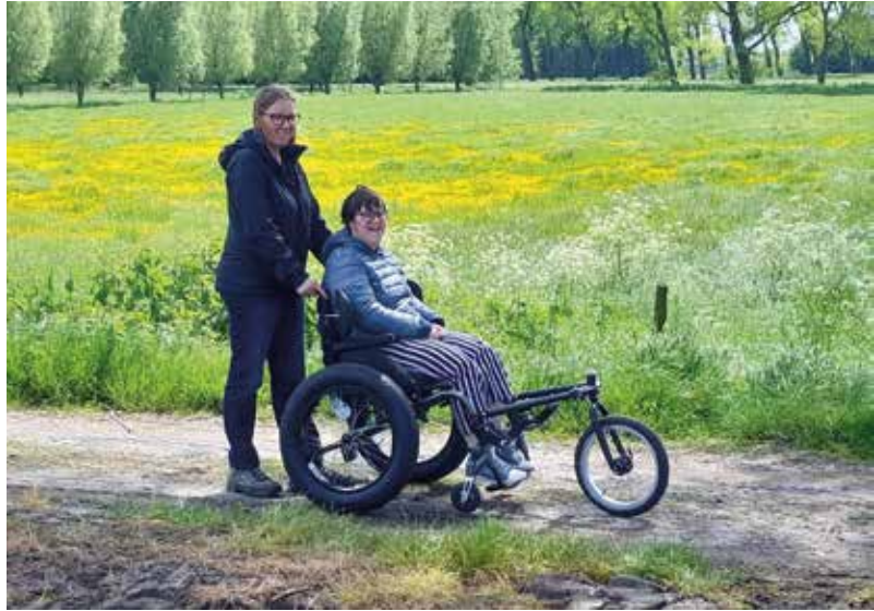
Geniet van de rolstoelroute met een offroad rolstoel