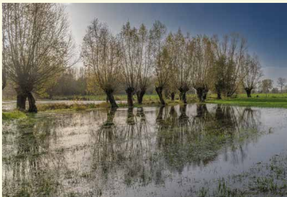
Sfeerbeeld van de overstromde vallei

Langs het Schipdonkanaal ligt een oude zandwinningsput, die nu de meest waardevolle plas is voor watervegetatie en waterinsecten. Op zonnige zomerdagen vliegen heel wat libellensoorten boven het water en rond de oevertvegetatie, terwijl de roodachtige bloei van het aarvederkruid een groot deel van de plas bijna helemaal bedekt. Ook hier pleisteren in het winterseizoen tientallen krakeenden en wilde eenden en kan je het hele jaar rond de ijsvogel waarnemen.