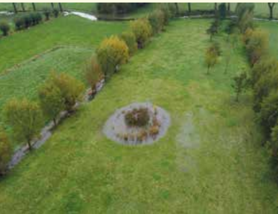
Een poel, de kronkelende Kale en de haakse grachten typeren dit gebied.

Tussen 1970 en 2000 werd op verschillende plaatsen langs het Kanaal Gent-Oostende aan zandontginning gedaan. Dat zand werd onder meer gebruikt voor de aanleg van bruggen in de buurt. Het gevolg is dat op deze plekken nu waterplassen liggen. Dat is hier het geval tot aan het Lambeekstraatje, iets verderop aan Kapel Ter Durmen en aan de Schipdonkplas, en op het einde van de wandeling aan de Molenmeers en de Zuurhoek. De Vlaamse Landmaatschappij (VLM) zorgt samen met Natuurpunt, de betrokken gemeenten en andere partners voor een betere toegankelijkheid van de omgeving, met respect voor de natuurwaarden.