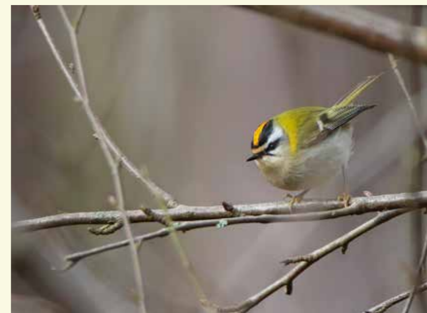
Het vuurgoudhaantje krijg je niet gauw te zien, maar misschien kan je wel de fijne pieptonen horen waarmee hij communiceert

Bewegwijzering: volg het plannetje of download de gps-tracks op www.npmeetjesland.be/fietsenwandel . Drie lussen, telkens in een verschillend landschap (1 + 1,5 + 2,5 km).