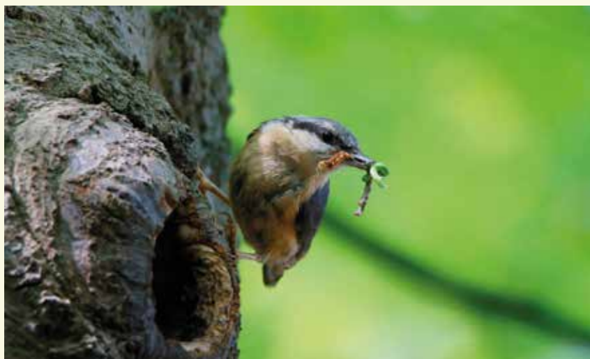
De boomkruiper kruipt op en neer op de stam van een boom