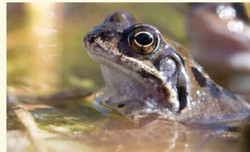
De bruine kikker leeft in en rond de poelen van het natte stuk bos

Hier komen we bij een volledig nieuw aangelegd loofbos bestaande uit zomereik, zwarte els en es. Hier wonen vogels als boomkruiper en boomkruiper. Aan de ingang zie je voor je een eerste amfibieënpoel, wat aangeeft dat je hier in een veel natter, lager gelegen gedeelte van de Oosteeklose Bossen bent. Je kan volledig rond het bos wandelen. Het wordt jammer genoeg middenin doorsneden door een open ruimte als gevolg van de aanleg van de gasleiding die hier onder de grond loopt. Aan de zuidkant is het bos begrensd door de Burggravenstroom.