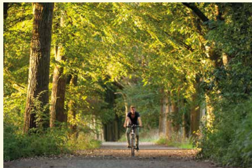
Op het noordwaartse stuk van de Antwerpse Heirweg liggen geen kasseien

Heb je zin in nog een rondje? Ga dan recht door de kasseien op, richting Tervenen en Ertvelde. Als fietser voel je je hier een beetje in Parijs-Roubaix, maar te voet is er ruimte genoeg om in de zachte berm verder te wandelen. Deze beukendreef wordt links en rechts omgeven door aanplantingen van grove den. Deze den herken je aan zijn oranjeleukige, schilferige schors.