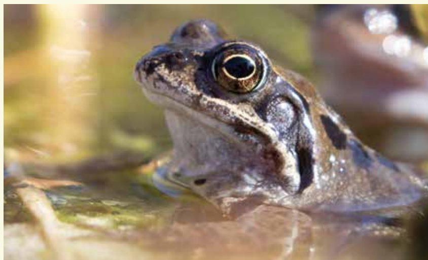
De bruine kikker leeft in en rond de poelen van het natte stuk bos

Hier komen we bij een volledig nieuw aangelegd loofbos bestaande uit zomereik, zwarte els en es. Hier wonen vogels als boomklever en boomkruiper. Aan de ingang zie je voor je een eerste amfibieënpoel, wat aangeeft dat je hier in een veel natter, lager gelegen gedeelte van de Oosteeklose Bossen bent. Je kan volledig rond het bos wandelen. Het wordt jammer genoeg middenin doorsneden door een open ruimte als gevolg van de aanleg van de gasleiding die hier onder de grond loopt. Aan de zuidkant is het bos begrensd door de Burggravenstroom.