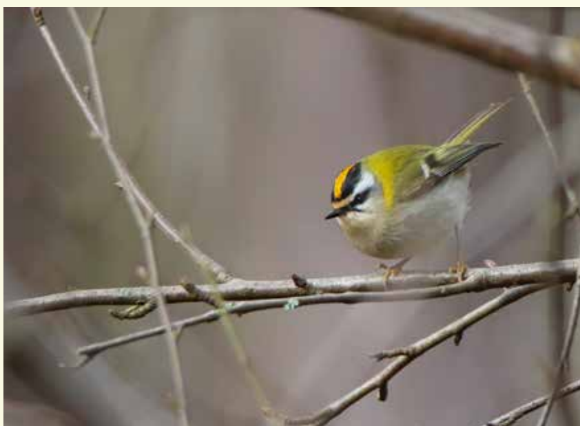
Het vuurgoudhaantje krijg je niet gauw te zien, maar misschien kan je wel de fijne pieptonen horen waarmee hij communiceert

Bewegwijzering: volg het plannetje of download de gps-tracks op www.npmeetjesland.be/fietsenwandel . Drie lussen, telkens in een verschillend landschap (1 + 1,5 + 2,5 km).