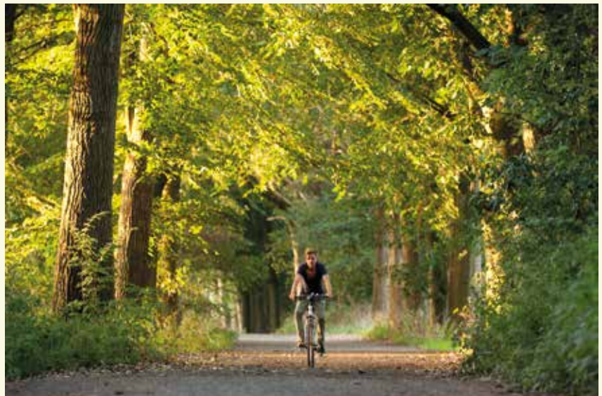
Op het noordwaartse stuk van de Antwerpse Heirweg liggen geen kasseien